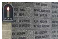
Foto: Placă dedicată comemorării victimelor Pogromului (Muzeul Evreiesc Iași)