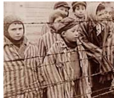
Foto: Copiii evrei într-un lagăr de concentrare

1942-1945 - Au loc masacre colective în lagărele de exterminare de la Auschwitz, Chelmno, Treblinka, Maidanek, etc.