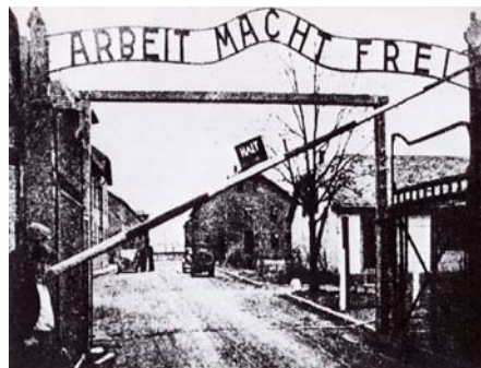
2. Auschwitz, Poland - Concentration camp opens April 1940 The message: "Work makes one free."

Teme-te de propriile-ți gânduri, căci ele nasc cuvinte, Teme-te de propriile-ți cuvinte, căci ele devin fapte, Teme-te de propriile-ți fapte, căci ele devin obiceiuri, Teme-te de propriile-ți obiceiuri, căci ele îți modelează caracterul.