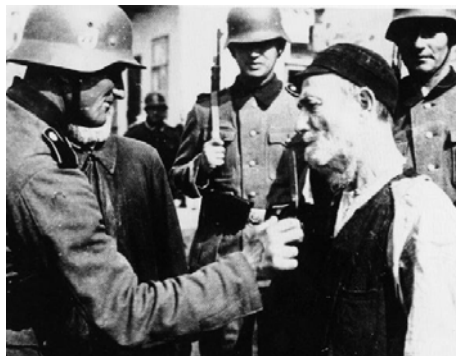
Foto: Soldații ai celui de-al III-lea Reich batjocoresc un evreu polonez, tăindu-i zulfii.

Teme-te de propriile-ți gânduri, căci ele nasc cuvinte, Teme-te de propriile-ți cuvinte, căci ele devin fapte, Teme-te de propriile-ți fapte, căci ele devin obiceiuri, Teme-te de propriile-ți obiceiuri, căci ele îți modelează caracterul.