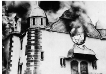
Foto: Kristallnacht ("Noaptea de cristal". O sinagogă în flăcări la Siegen - Germania, 10 noiembrie 1938)

1938 - " Noaptea de cristal " (9-10 noiembrie): 200 de sinagogi distruse, 7.500 de magazine vandalizate, 100 de evrei uciși, 30.000 de evrei trimiși în lagăre de concentrare;